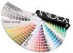
Su Remmers dekoratyviomis sistemomis, vaizduotei nėra ribų.

Ši danga mėgiama žmonių, norinčių turėti kažką įspūdingo, nepakartojamo. Įsitinkite patys.