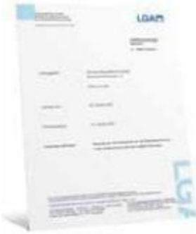
Apsauga pagal patikrintą kokybę

Remmers dangų sistemos apsaugo Jūsų grindis nuo aukštos mechaninės apkrovos, suteikia aukštą, sertifikuotą patvirtintą atsparumą nuo rūgščių, šarmų ir kitokių chemiškai agresyvių aplinkų, antistatinės grindys apsaugo nuo elektros krūvių, elastingos grindys – patalpoms su didelėmis dinamiškomis apkrovomis ir patalpoms, kuriose vyrauja temperatūros svyravimai. Mūsų produktai, neturintys nonilfenolio, nekenkia žmogaus sveikatai, malonūs apdirbant ir eksploatuojant. Daugiau informacijos gausite kreipdamiesi į Remmers vadybininkus. Mes su malonumu Jums padėsime.